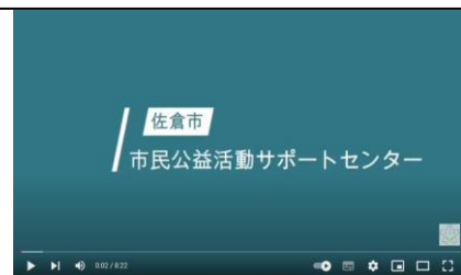
情報サイトにアップしているサポセンの紹介動画です。

まだまだ、不慣れな点もありますが、私たちの技術のスキルアップや内容の充実を目指し、努力してまいります。サポセンからの情報を数多くの市民の皆様にお伝えできるよう、より一層努力してまいります。