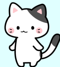
しりあぶりねこ ©佐倉市

当センターは、コロナ禍において活動される団体の皆様に側面から支援するための活動拠点であるとともに、企画事業・情報提供などを継続的に行っております。本号では、令和4年度の活動状況の一部について紙面を通じてお知らせいたします。