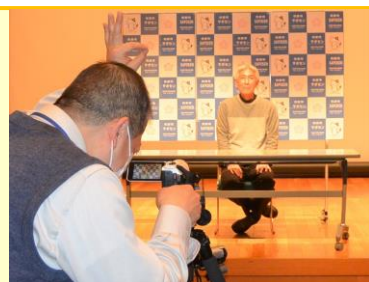
背景ボードは手作り!

始めたばかりですが、順次紹介する市民公益活動団体を増やしていき、一緒に活動してみたいと思っている人への選択の幅を増やしたいと考えております。お楽しみに♡