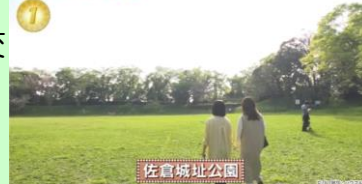
アド街ック天国で紹介された 人気NO1の佐倉城址公園