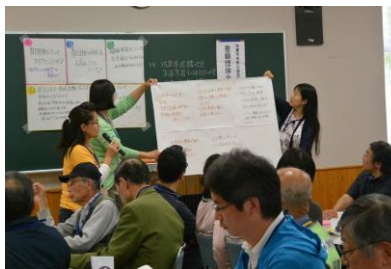
色々なアイデアを発表中！

4つのテーマに対してグループワークを行いました。 *貴団体にとってサポセンとは… には、情報発信の場、悩みごとの捨て場、他の団体との交流の場、会議室の利用、資料作成のための印刷やコピーが利用できるなどのご意見。 *貴団体が抱える悩みごとは… には、会員の高齢化、新会員の獲得、役員になる人がいないなどのご意見。 *団体内の情報伝達は… には、メールの活用、HPや回覧、定例会での情報交換などのご意見がありました。 *フェスタについては 、たくさんの人と知り合い仲間になって盛り上がり嬉しかった。会員の増加につながった。他団体の活動を知る機会となった。子どもの参加が多くて良かった。反面、集客のために何を考えるべきか、もっと市民にPR、活発な会にして欲しい。など参考になるご意見をたくさんいただきました。登録団体の一部ではありませんが、団体間の交流が図れた会となりました。