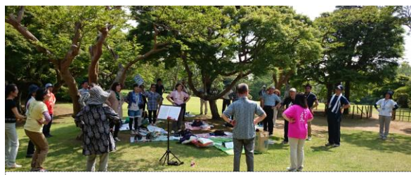
昼食後、笑いヨガでリフレッシュ！（旧堀田邸・庭園にて）