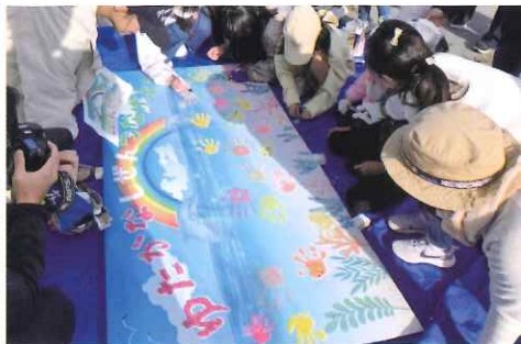
勿来まちづくりサポートセンター