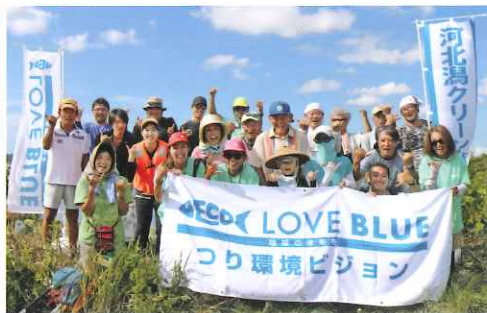
河北潟クリーン作戦実行委員会