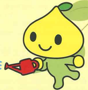
公式キャラクター ピットくん